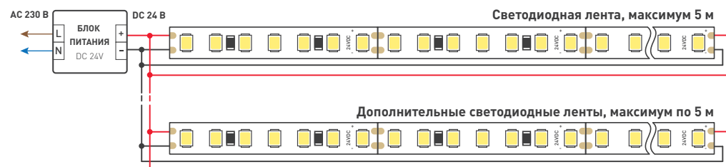
Схема 1. Подключение нескольких светодиодных лент с двух сторон